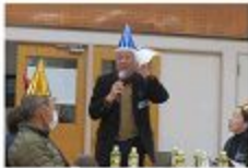
支え合い推進会議について (田村会長)