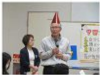
開会あいさつ (瀬戸島振興会長)