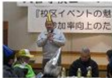
趣旨説明 (加茂事務局長)